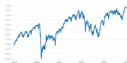
Euro Stoxx 50