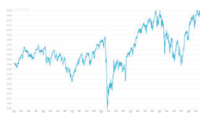
Euro Stoxx 50