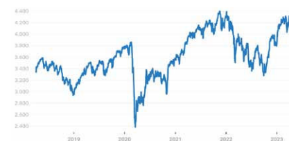
Euro Stoxx 50